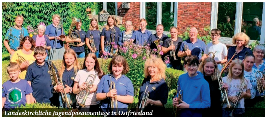
Landeskirchliche Jugendposaunentage in Ostfriesland

sowie Rhythmus und Notenlesen zu lernen gab. Außerdem ist nicht nur die musikalische Unterstützung der 30 jungen Blechbläser unter sechzehn Jahren erforderlich, sondern auch die Aufsichtspflicht eine verantwortungsvolle Aufgabe, die die Ausbilder aus den Chören grundsätzlich selbst übernehmen. Am Samstag ist immer auch Zeit für die Satzproben, mit Unterstützung von D-Chorleitern. Ziel ist die Begleitung des Gottesdienstes am Sonntag, in diesem Jahr zum Thema „Bewahrung der Schöpfung“.