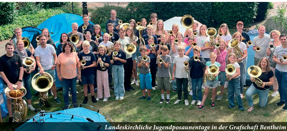
Landeskirchliche Jugendposaunentage in der Grafschaft Bentheim

sowie Rhythmus und Notenlesen zu lernen gab. Außerdem ist nicht nur die musikalische Unterstützung der 30 jungen Blechbläser unter sechzehn Jahren erforderlich, sondern auch die Aufsichtspflicht eine verantwortungsvolle Aufgabe, die die Ausbilder aus den Chören grundsätzlich selbst übernehmen. Am Samstag ist immer auch Zeit für die Satzproben, mit Unterstützung von D-Chorleitern. Ziel ist die Begleitung des Gottesdienstes am Sonntag, in diesem Jahr zum Thema „Bewahrung der Schöpfung“.